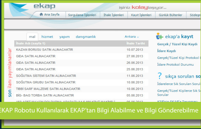
EKAP Robotu Kullanılarak EKAP'tan Bilgi Alabilme ve Bilgi Gönderebilme

Redimo Merkezi Tedarik ve Talep Takip Yönetim Sistemi: 4734 Sayılı Kamu İhale Kanunu, 4735 Sayılı Kamu İhale Sözleşmeleri Kanunu, 5018 Sayılı Kamu Mali Yönetimi ve Kontrol Kanunu, Merkezi Yönetim Harcama Belgeleri Yönetmeliğine uygun olarak tasarlanmıştır; talep toplama, satın alma ve teslimat sürecini yöneten bilgi yönetim sistemidir.